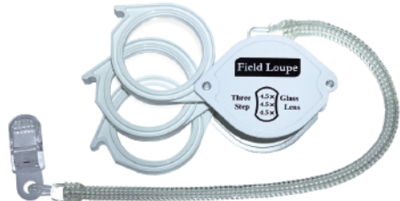
FIW-03SP / BP