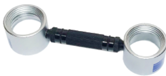
TWI-2 / BP