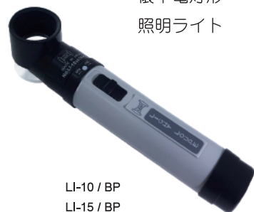
LI-10 / BP LI-15 / BP