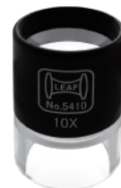
5410 / BP