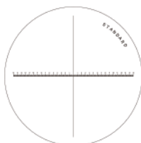
付属スケール (視野目安) S-200 (25) 対応スケール (別売) S-200 ~ S-212