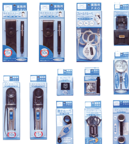
プリスターパック イメージ