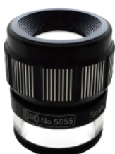
5055 / BP