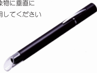
8040-25 / BP 8040-50 / BP