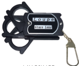
LAY-B3K / BP