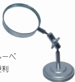
5021S / BP