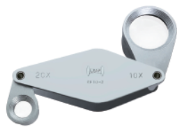
RF20-4 / BP